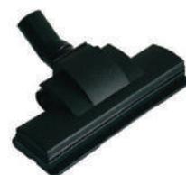
Spazzola triplo uso: moquette, legno, pavimento