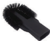
Spazzola per radiatori