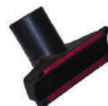
Spazzola per materassi e tappezzeria