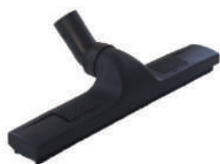
Spazzola con ruote per pavimenti

Per tutti i tipi di pavimento, tappeti, materassi, abiti, animali, etc.