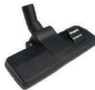
Spazzola doppio uso: pavimento e tappeto